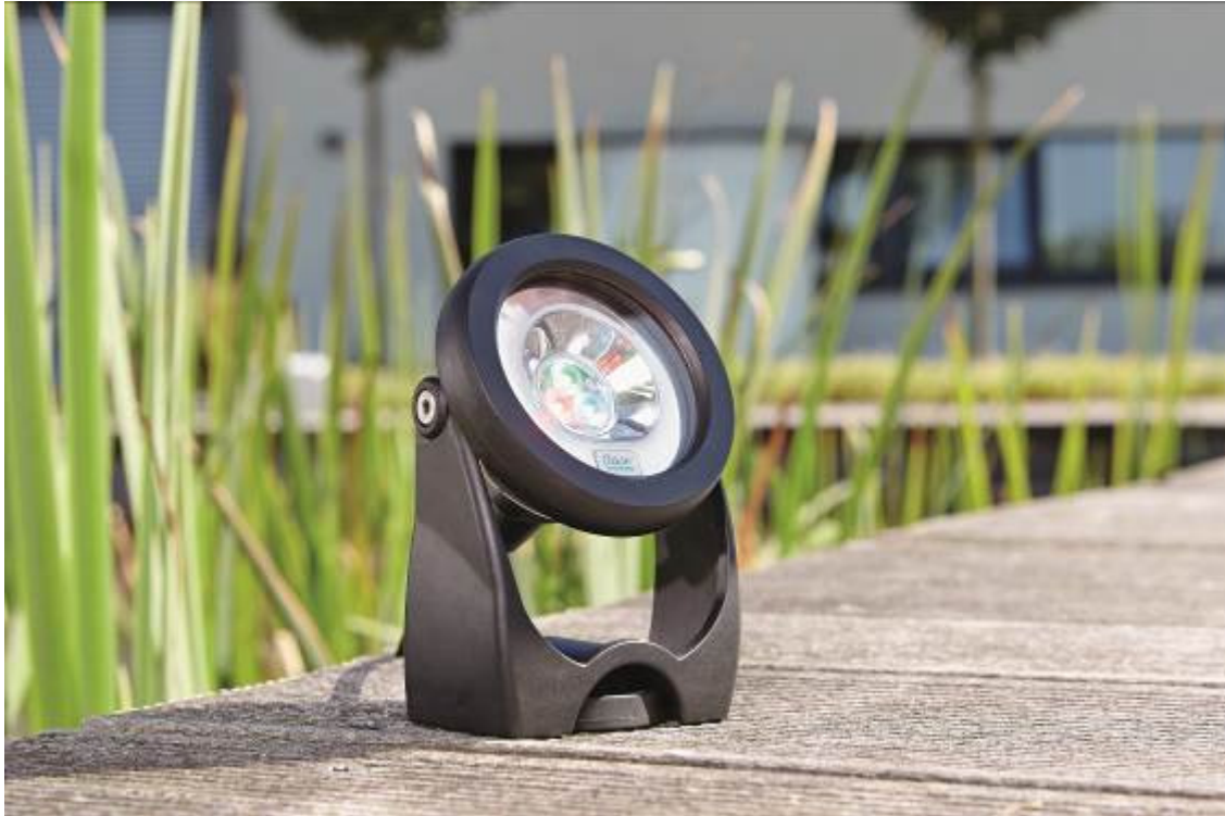
Ganz einfach per App steuerbar: Der ProfiLux Garden LED RGB.