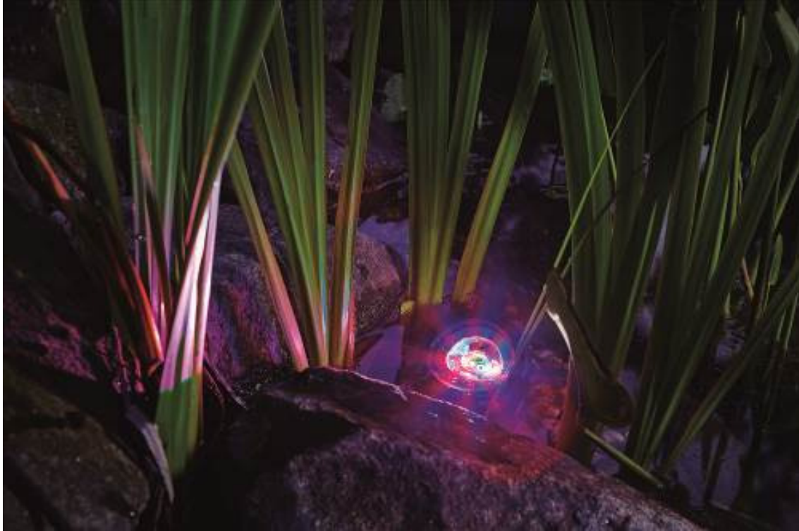
Für ein buntes Lichtermeer im Garten: Der Profilux Garden LED RGB-Scheinwerfer. (Bild: OASE GmbH).