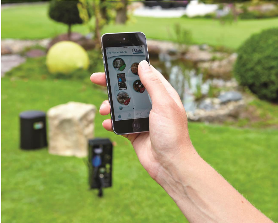
Teichtechnik ganz einfach mit der Smartphone per WLAN steuern: mit dem InScenio FM-Master WLAN EGC.