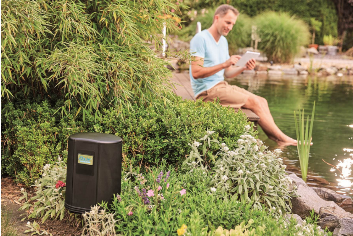
Gut versteckt: Das neue Top-Modell der FM-Master Reihe: InScenio FM-Master WLAN EGC.