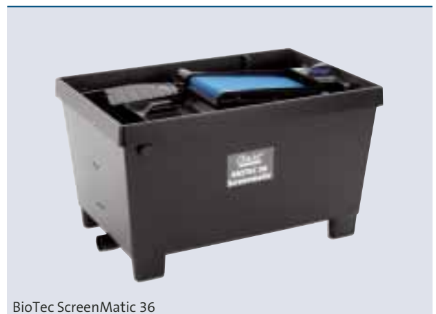
BioTec ScreenMatic 36