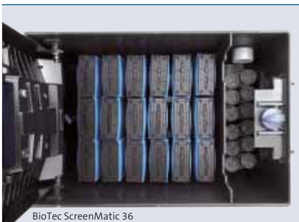
BioTec ScreenMatic 36